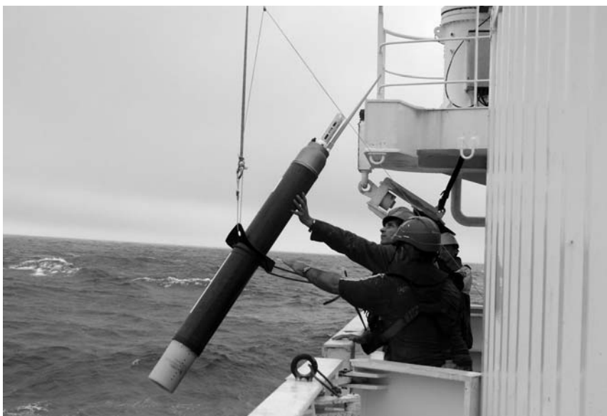
Mise à l'eau de l'un des 3 000 flotteurs du réseau Argo.

Lancé en 2000 par une trentaine de pays, et pleinement opérationnel depuis 2007, le programme Argo a permis l'immersion, dans l'ensemble des océans et des mers du globe, de 3 000 petits robots autonomes. Alternant les plongées jusqu'à 2 000 mètres de profondeur et les remontées à la surface, comme des ludions, ces « flotteurs profilants » mesurent en temps réel la température et la salinité des colonnes d'eau. Les données sont relayées en continu vers des centres de traitement, dont les deux principaux sont implantés aux États-Unis et en France, sur le site de Brest (Finistère) de l'Ifremer.